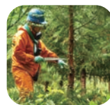
ツル切り・枝打ち