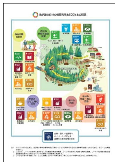
特集ページより

公表された白書の全容は、下記リンクから林野庁ホームページをご覧ください https://www.rinya.maff.go.jp/j/kikaku/hakusyo/index.html