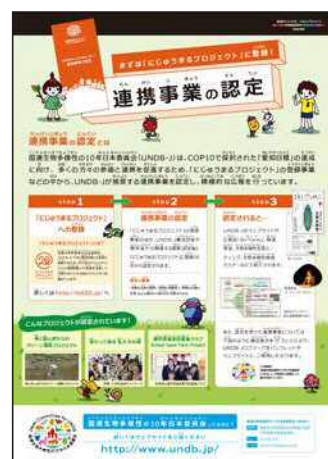
※画像をクリックするとブラウザが開き、大きく表示されます

国連生物多様性の10年日本委員会(UNDB-J)では、生物多様性の保全に資する活動が各セクターで連携して行われることを促進するため、推奨する連携事業を認定しています。今年3月には第16弾として、10件の連携事業認定が発表されました。認定対象は、2010年に愛知県名古屋市で開催された生物多様性条約第10回締約国会合(CBD-COP10)で示された「愛知ターゲット」達成のため立ち上げられた「にじゅうまるプロジェクト」に参画する事業が中心で、「多様な主体の連携」「取組の重要性」「取組の広報の効果」などの観点から総合的判断で認定されます。認定された連携事業は、UNDB-J のウェブサイト、生物多様性全国ミーティング、生物多様性地域セミナー等などにおいて紹介されるなど、積極的な広報が実施されます。