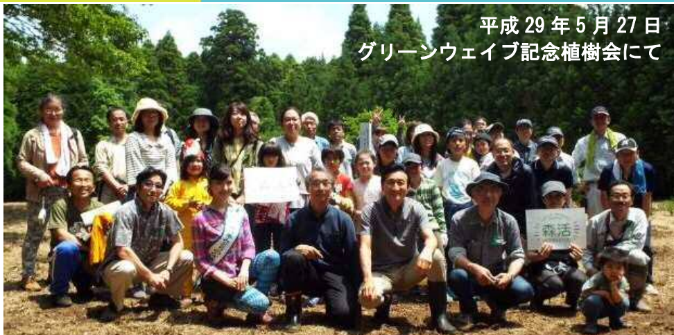
平成 29 年 5 月 27 日 グリーンウェイブ記念植樹会にて

旧年中は格別のご高配を賜り、誠にありがとうございました。 皆さまからの温かいご助言を支えに、関係者一丸となって資源循環事業と森林再生事業に取組み、環境課題の解決に邁進して参る所存でございます。 本年もなお一層のご支援を賜りますようお願い申し上げますとともに、輝かしき新春を迎え、皆様の御多幸をお祈り申し上げます。