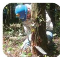
ツル切り・枝打ち